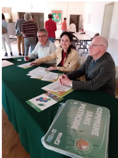
Saint-Martin-sur-Ocre le 6 avril 2018