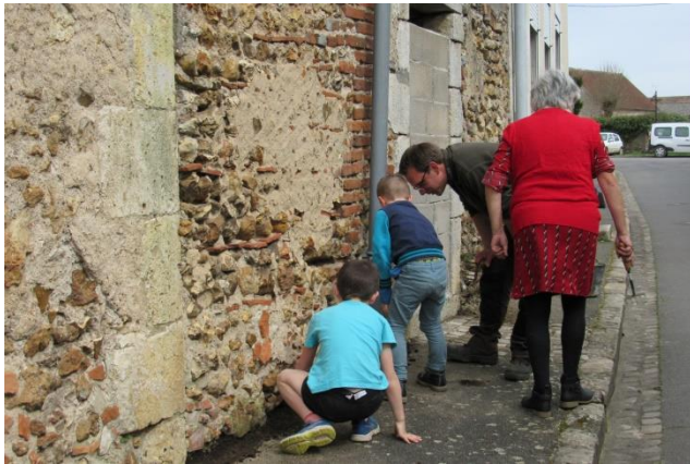
Saint-Gondon le 11 mai 2018