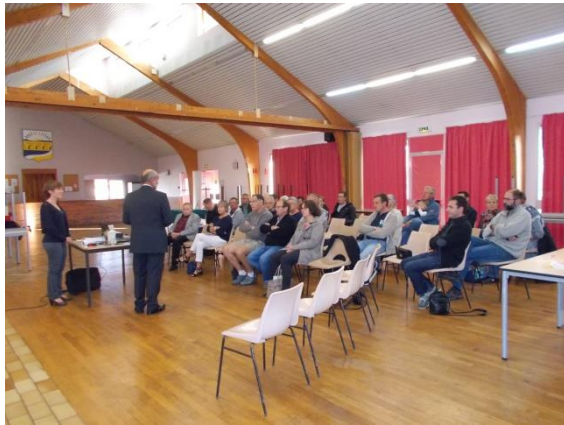
Poilly-lez-Gien le 13 septembre 2017