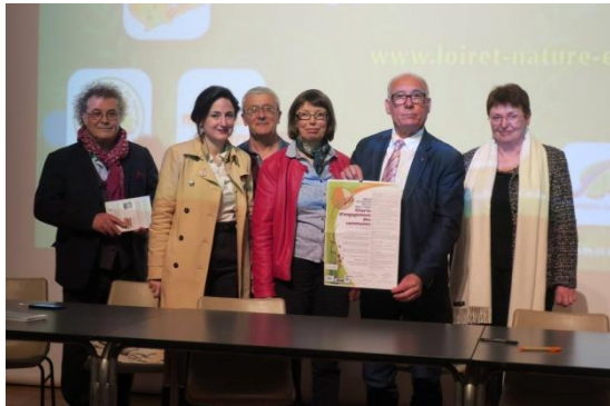
Briare le 11 avril 2018