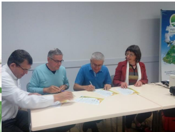
Saint-Gondon le 29 septembre 2017