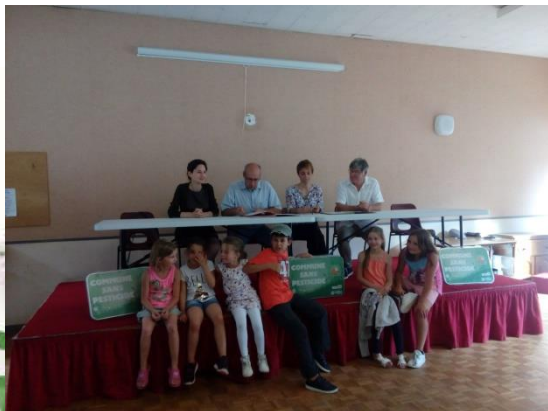
Les Choux et Langesse, le 3 juillet 2018