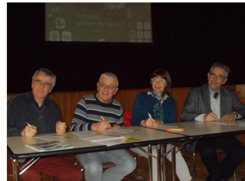
Bonny-sur-Loire le 24 janvier 2018