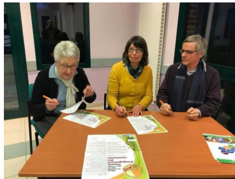
Pierrefitte-ès-Bois le 16 février 2018